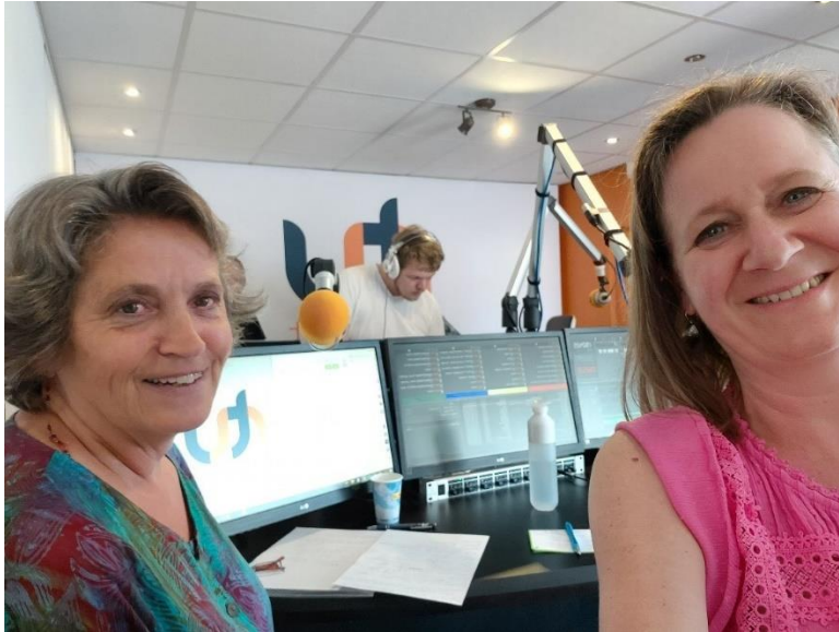
Interview RTV Connect

Tot slot was er ook aandacht voor de Write for Rights op 10 december in beide bovengenoemde Zevenaarse kranten en de lokale radiozender RTV Connect.