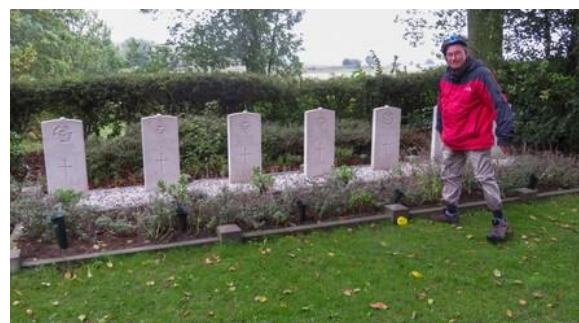
Oorlogskerkhof Tolkamer aan de Rijn