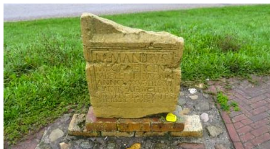
Happy Stone bij Romeinse steen Herwen

Op 24 september maakten we een fietstocht van 50 kilometer langs dorpen in de gemeente Zevenaar in verband met het 50-jarig jubileum van de werkgroep. In de dorpen die aangedaan werden, legden we op markante punten Happy Stones.